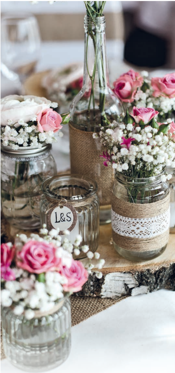
BEISPIEL FESTSAAL „PAVILLON“ TGIASA PRINCIPALA | 300 m 2